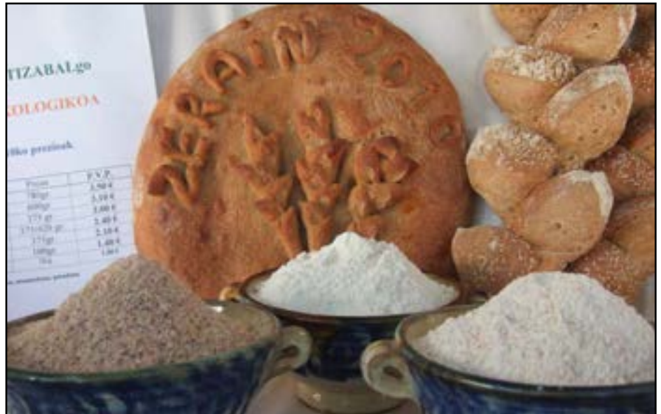
Zeraingo azokan oraindik era egoten da zikirioa ikusteko eta erosteko aukera.

Zerainen centeno esan nahi du zikirioak , ez seada . Hala esan nahi du edo,