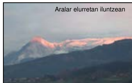
Aralar elurretan iluntzean

Urtarrilak 48 litro eskas baino ez dizkiugu utzi euritan. Ezin esan dezakegu beraz hil bustia joan denik; are gutxiago kontuan hartzen badugu, adibidez iaz 239 litro egin zituela hil berean, eta azken 11 urteetan hiru aldiz baino ez dituela 100 litro baino gutxiago egin (2000an, 2002an eta 2006an). Horrez gain, tenperaturak ere hilteltzari dagozkionak baino epelagoak izan dira: bost egunetan gerturatu da termometroa 20 gradu ingurura. Zerpekoak, berriz, ez dira hainbeste izan; eta beraz, hilteltza nahiko leuna joan zaigula esan dezakegu.