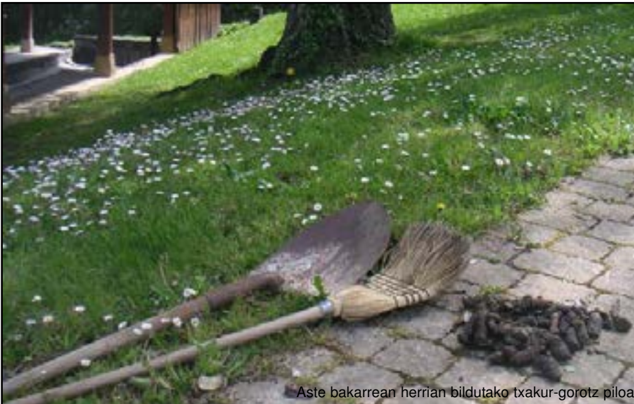
Aste bakarrean herrian bildutako txakur-gorotz pila