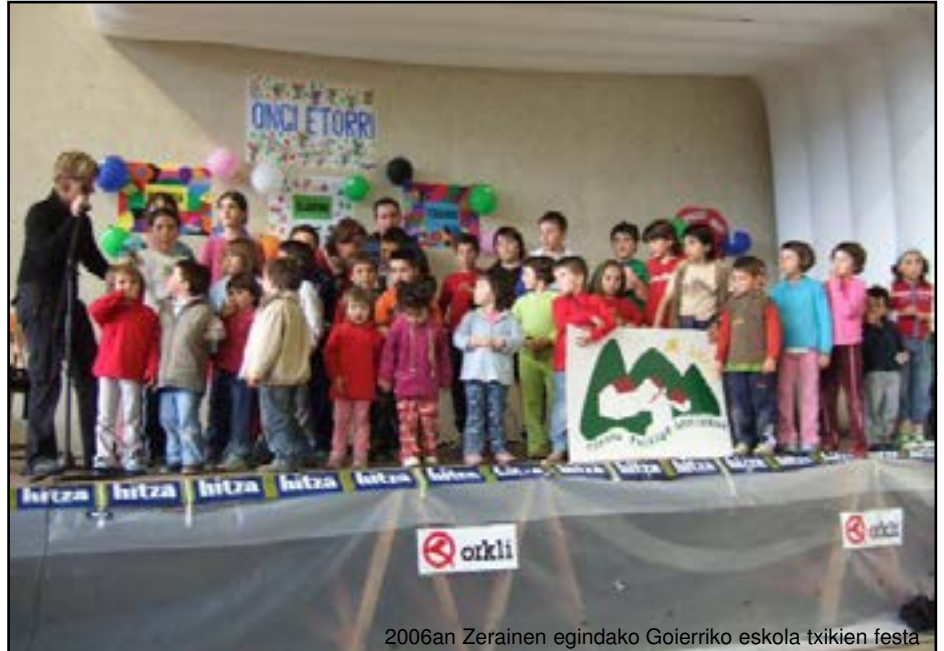
2006an Zerainen egindako Goierriko eskola txikien festa

Aurki beteko dira bi urte Zerainen Gipuzkoako Eskola Txikien Eguna ospatu genuenetik. Orduko oroitzapenak ahaztu gabe, gure eskola txikiak aurrera jarraitzen du bizi-bizirik, oztopo guztiak gaindituz. Aurten Gipuzkoako eskola txikien festa Altzon izango da, baina Zerainen ere izango da beste ospakizun bat: Goierriko eskola txikien urteko festa. Itsasondo, Olaberria, Gabiria eta Zeraingo eskolek urtero herri hoieta-ko batean egiten duten jaia antolatzea Zeraini tokatzen zaio aurten. Basarte Guraso Elkarteak maiatzaren 8 arratsalderako egitarau bete-betea prestatu du: ipuin-kontalaria, puzgarriak, tailerrak, pedaloak... ez da ezer falta-ko lau herrietako haur, guraso eta irakasleek elkarrekin bailarako eskola txikien festa ospa dezaten.