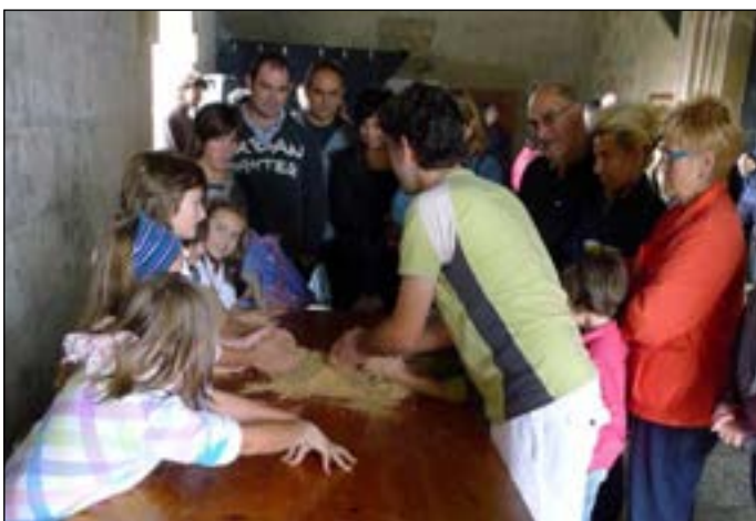
Gozogintzako tailerlean majo disfrutatu zuten txikienek.