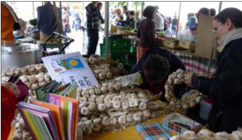
Salmenta postu koloretsuak egon ziren azoka hasieran. Amaieran gehiena salduta.