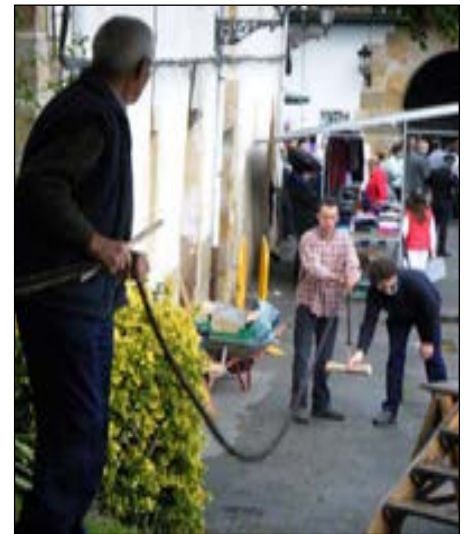
Ikuskizun polita izan zen sokagintza.