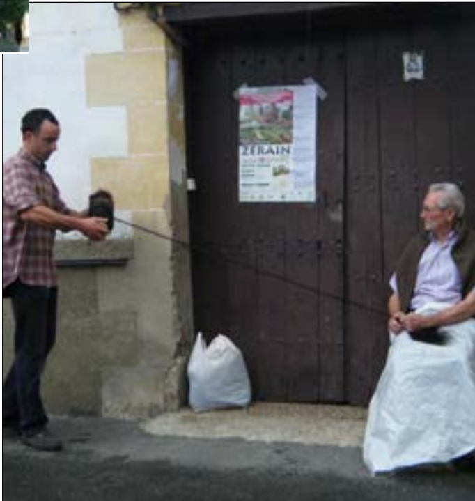
Behorraren ilearekin era zaharrera soka egin zuten.