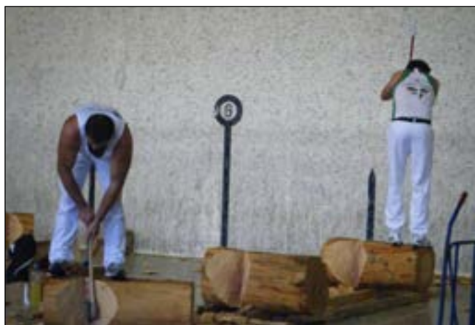
Kana-erdi pasatxoko seina egur moztu zituzten aizkolariek.