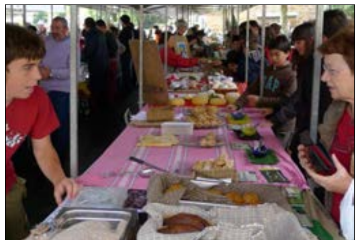
Euriaren beldurra gaituta, jendea erosteko gogoz etorri zen.