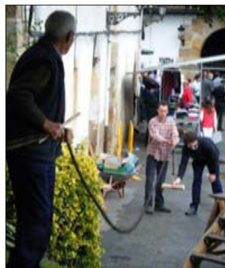
Ikuskizun polita izan zen sokagintza.