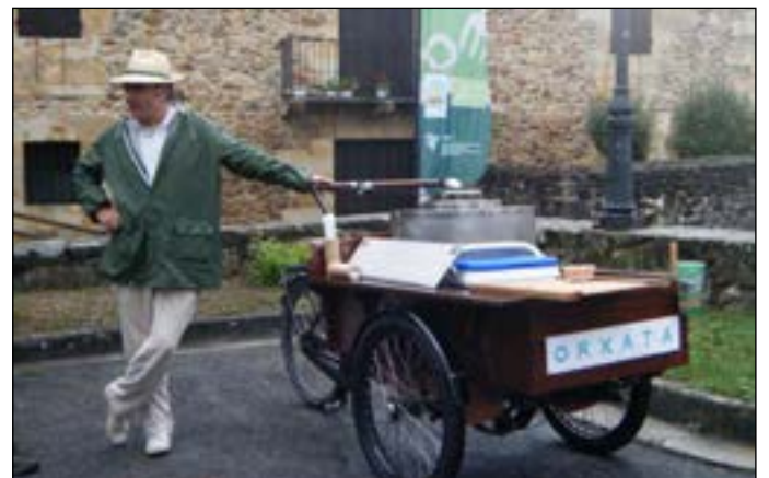
Ortxataria ere etorri zen karro eta guzti.