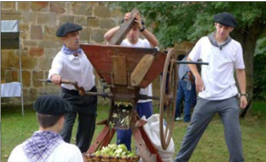
Sagar asko ez egon arren, muztio bikaina egin zuten herriko gazteek tolaean.