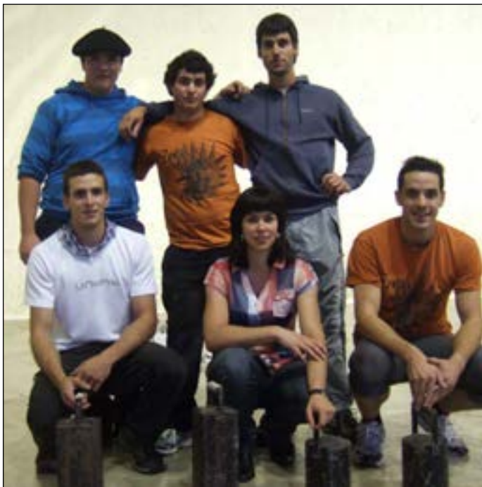
Txingetan parte hartu zutenak lana egin ondoren.