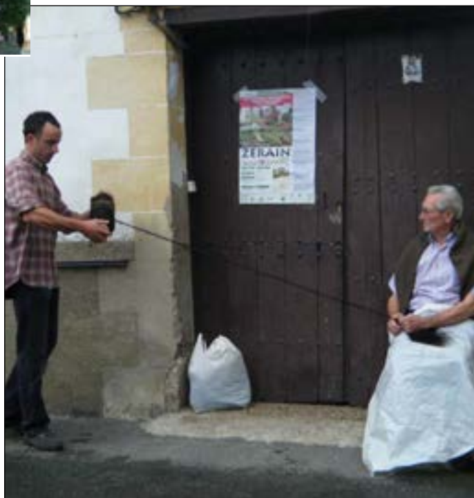
Behorraren ilearekin era zaharrera soka egin zuten.