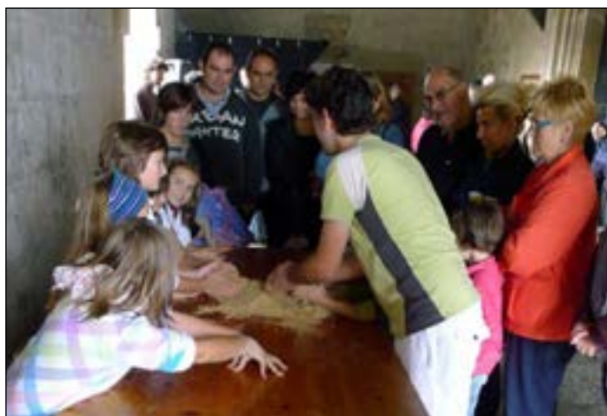
Gozogintzako tailerlean majo disfrutatu zuten txikienek.