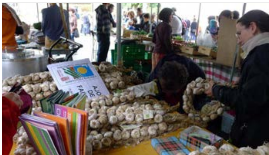
Salmenta postu koloretsuak egon ziren azoka hasieran. Amaieran gehiena salduta.