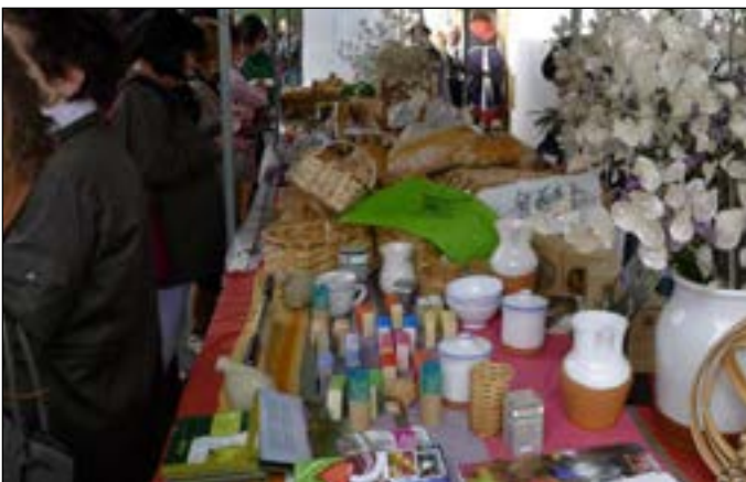
Herriko produktuekin ere postu bikaina jarri zuen Mandiok.