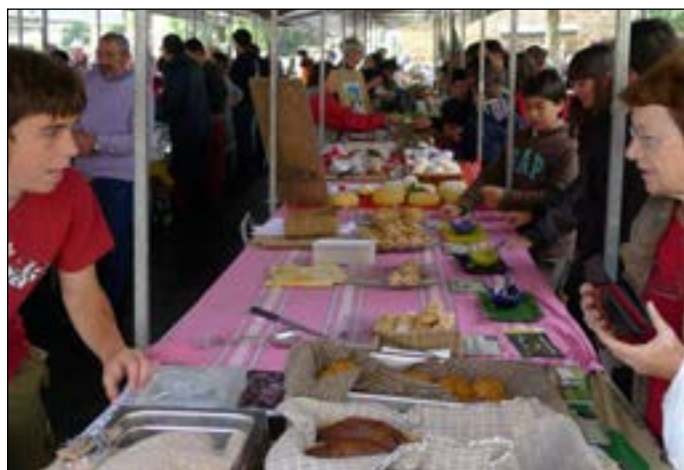
Euriaren beldurra gaituta, jendea erosteko gogoz etorri zen.