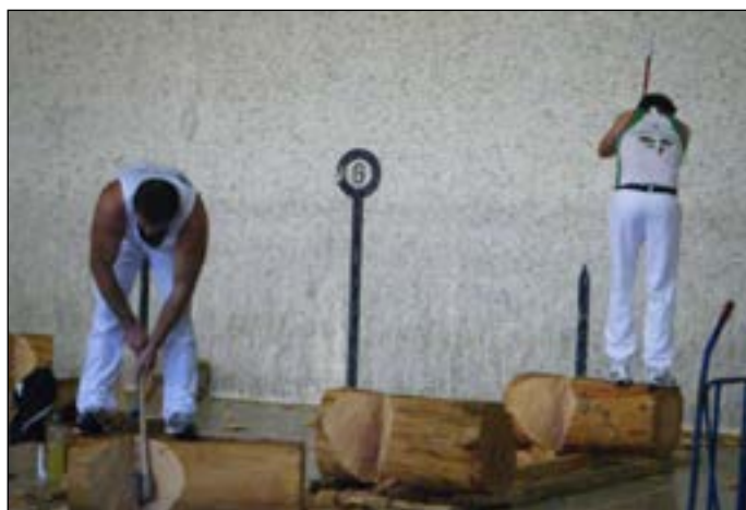
Kana-erdi pasatxoko seina egur moztu zituzten aizkolariek.