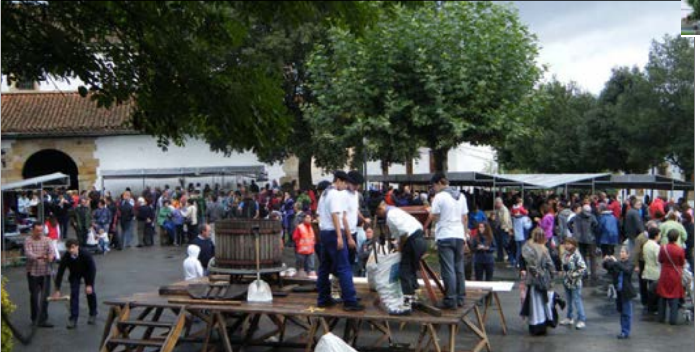
Goizean goiz euria gogoz ari bazen ere, eguerdirako atertzera egin zuen eta jendea erruz ibili zen plaza aldean.