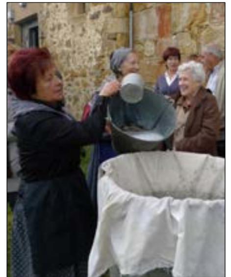
Lixibagileak urtero bezala fin aritu ziren.