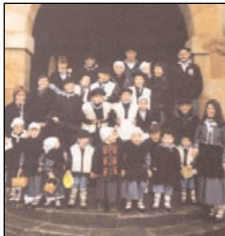
Oso dotore egongo dira umeak. ESKOLA

Eta azkenean iritsiko da egun handia: abenduaren 24a. Goizeko 9:30ak aldera irtengo gara plazatik haurrak, gurasoak eta irakasleak. Etxez etxe ibiliko gara kantuan eta eskean. Zerain gunea eta inguruko etxeak pasako ditugu eguerdi artean. Urtero diru asko biltzen dugu eta diru hori oso baliagarri izaten dugu urtean zeharrerako. Horregatik, alde zuzenetik eskerrak eman nahi