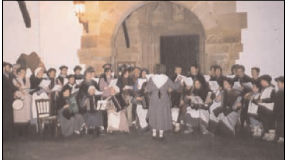
Uharka abesbatzak eta herriko haurrek Olentzerori kantatuko diote. E. MENDIZABAL

Abenduaren 24an, herritar taldea etxez etxe ibiliko gara kantuan urteroko moduan. Horretarako prest dauden denak gustura hartuko ditugu. Utzi lotsak eta etorri denok gurekin Gabonetako euskal kantu zahar-rrak etxez etxe abestera. Entsaioa, ostiralean, 23an, egingo da kultur etxean, iluntzeko 7etan. Ahal duten guztiak bertara joan daitezela nahi dugu. Larunbatean, gabon egunean, goizeko 9etan irtengo gara kantuan. Barbari eta Zeraindik beherako dena