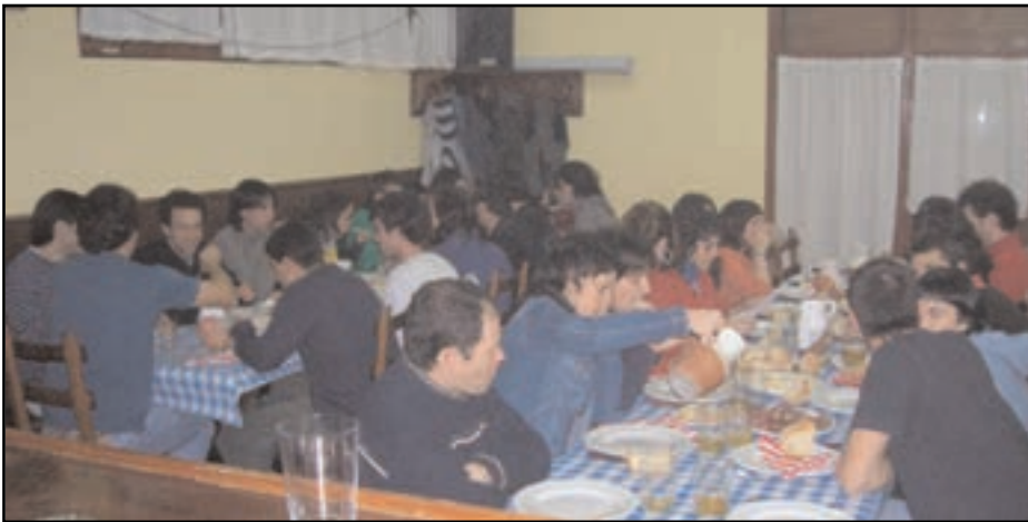
Aurten ere gazte asko bildu ginen barrikotean. MUÑOA

L arunbata, abenduak 10. Iluntzeko 9ak aldera edo. Sozidatean ez da toki gehiegi. Dena beteta dago eta zaharrenak ez ditu 30 urte baino askoz gehiago. Mostradorean kupela bat dago, garagardoarentzat erabiltzen diren horietakoa. Baina barruan sagardoa dago. Atetik kanpora hotz da, baina gaztainak erretzeko egindako suak berotatu